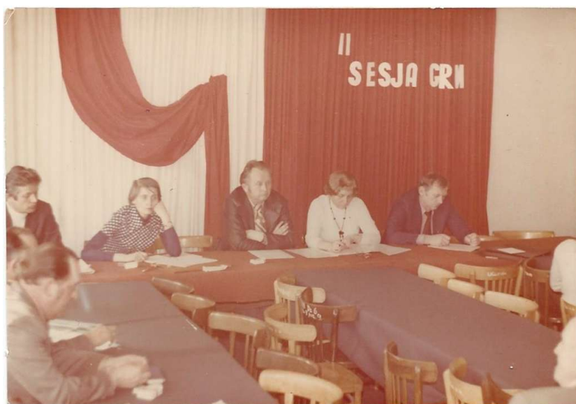
Obrady GRN (zdjęcie ilustracyjne)