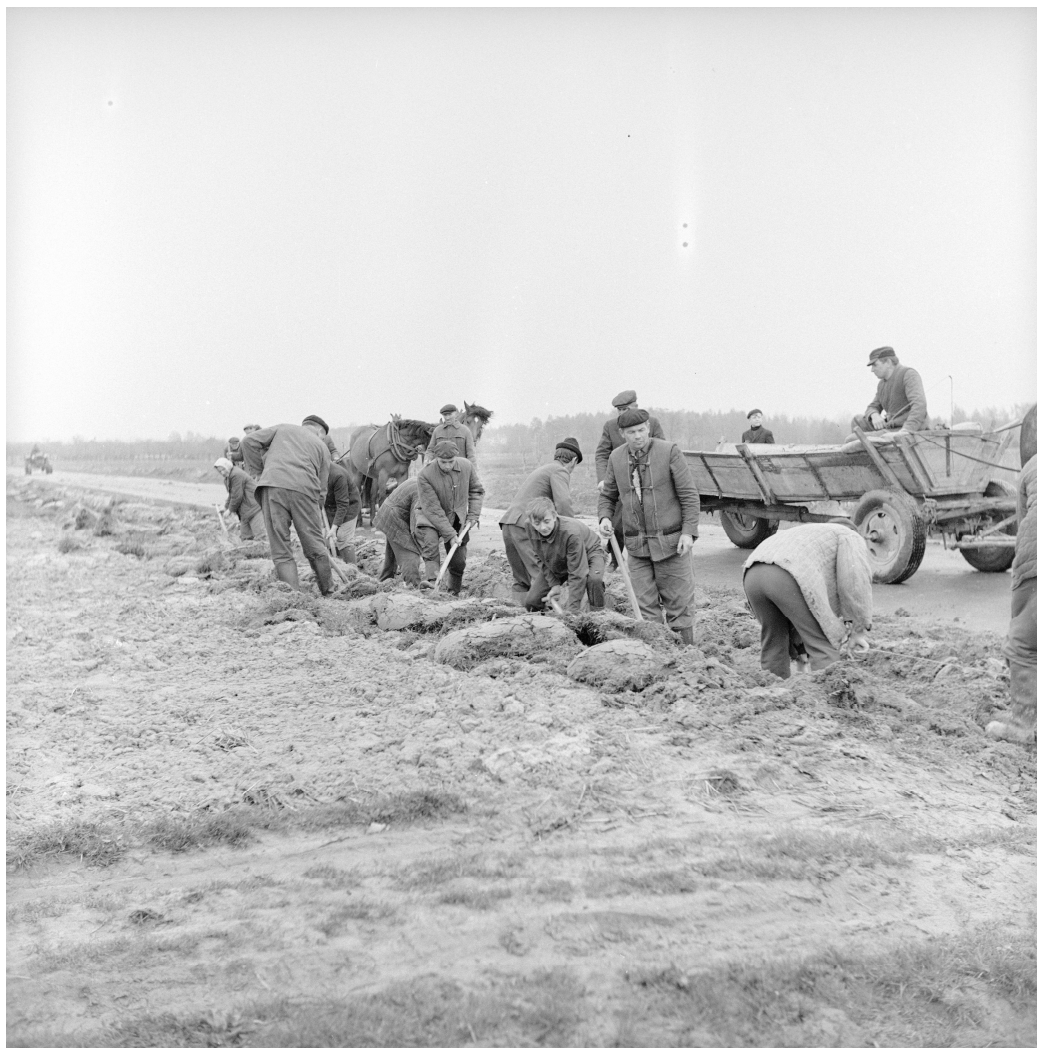
Budowa drogi czynnem społecznym

Władzom zależało na wyglądzie estetycznym wsi. W 1974 roku wydano 210 decyzji na zmianę pokryć dachowych wzdłuż trasy T-12 (Radom-Zwoleń). Rolnicy otrzymali skierowania po odbiór eternitu i blachy w Gminnej Spółdzielni. Na zmianę pokryć dachowym otrzymali rolnicy pożyczki bezprocentowe, natomiast dla najbiedniejszych zasiłki na zmianę pokryć wypłacało PZU.