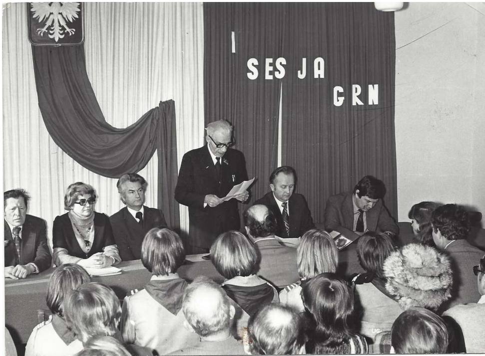
Pierwsza sesja GRN – zdjęcie poglądowe