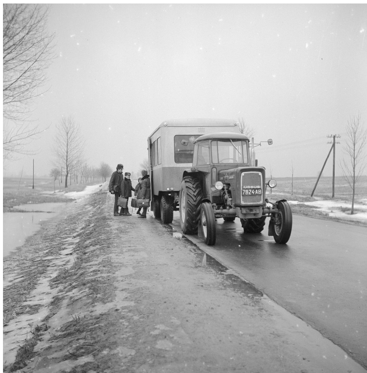
Dowóz dzieci do szkół